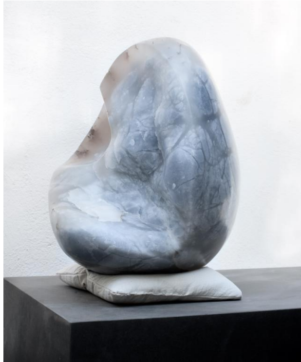
Franziska Seifert (Skulpturen aus Stein)

Die Steinskulpturen der Position von Franziska Seifert interpretieren das Thema von *TERRA INKOGNITO* und Bewegung auf eine ganz ungewöhnliche Weise. Ebenso vielfältig wie die Steintypen, die Franziska Seifert für ihre Skulpturen verwendet, sind auch die Deutungsmöglichkeiten der Figuren, die oft anthropomorphe Formen aufweisen und dabei meist nicht über einen fragmentarischen Ausschnitt hinausgehen. Ihre Skulpturen sind von Grund auf unbestimmt. Doch ist es gerade diese Unbestimmtheit, die in letzter Instanz dem ganzen Gebilde einen ungewöhnlich hohen Grad an (emotionaler) Bewegtheit verleiht. Die großformatigen Monotypien, die sie von einer Vielzahl ihrer Skulpturen anfertigt, reflektieren den Arbeitsprozess der Künstlerin auf eine faszinierende Weise. Weitere Informationen finden Sie auf der Webseite der Achtzig Galerie für Zeitgenössische Kunst: http://www.dianaachtzig.de und http://achtzig-kunstwettbewerb.appspot.com/ .